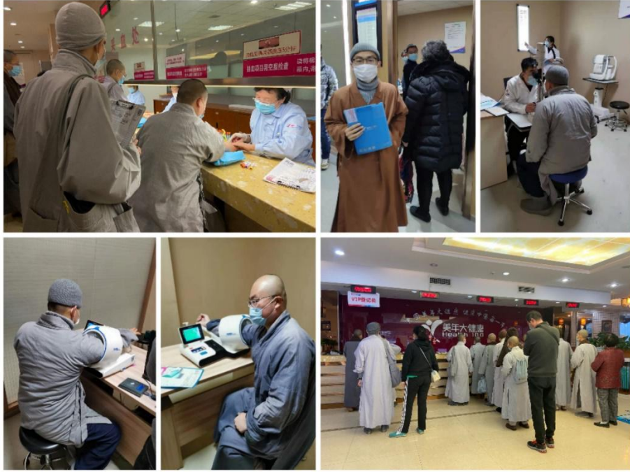
(图片说明：僧伽医养计划为法师提供免费健康体检)