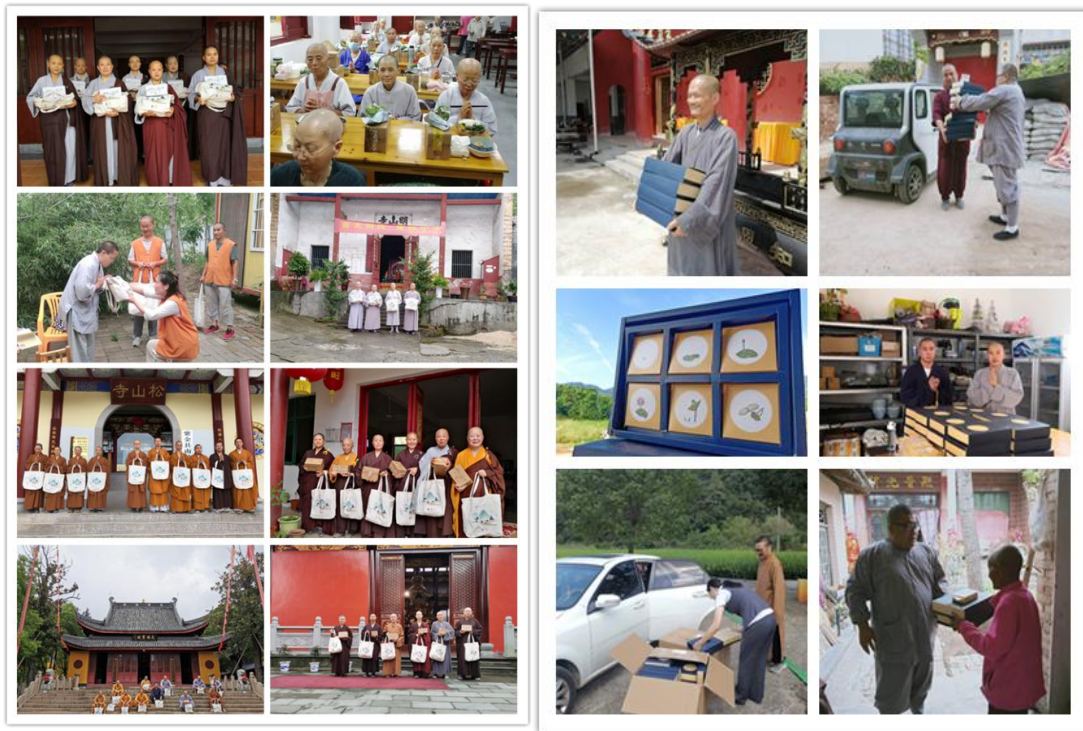
(图片说明：僧伽医养计划为僧伽提供生活物资)