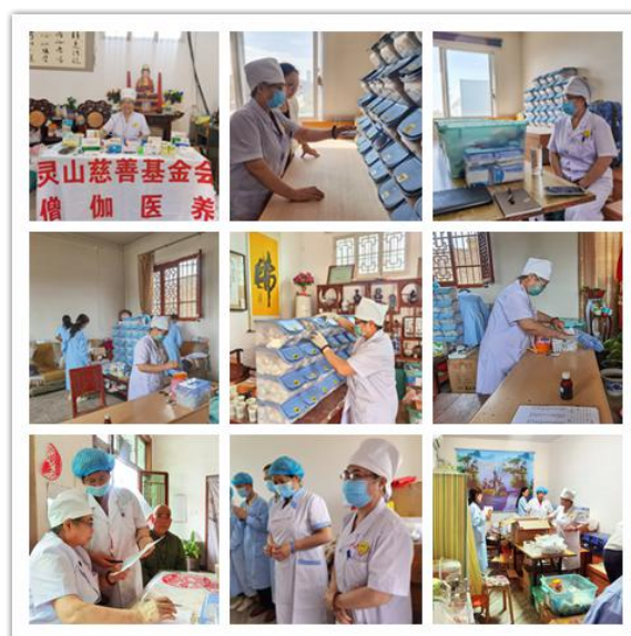
(图片说明：灵山慈善僧伽义诊团到道场开展义诊)

5. 救灾：2021年河南遭受千年罕见暴雨洪灾，僧伽医养项目团队与受灾地区道场联动，为当地道场提供必要生活物资并在实地走访考察后给予受灾严重的道场灾后重建支持，合计支出善款1308387.79元。